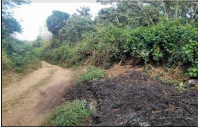
CALLE DE ACCESO