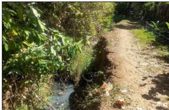
CALLE DE ACCESO