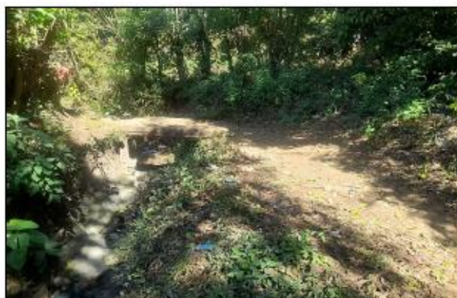
CALLE DE ACCESO