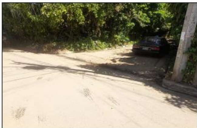
CALLE DEL ENTORNO