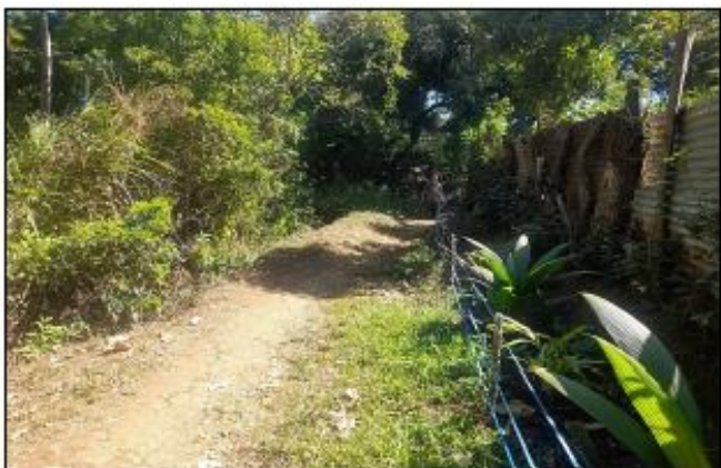
CALLE DE ACCESO