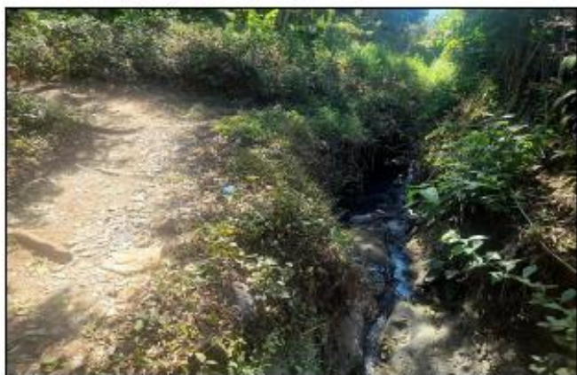
FACHADA - CANALETA DE AGUAS SERVIDAS