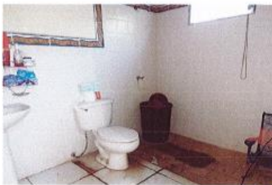
SS DORM. PPAL