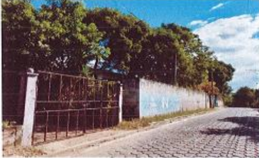
CALLE PRINCIPAL Y VIVIENDA