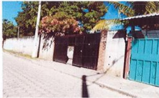
FACHADA DE INMUEBLE Y CALLE