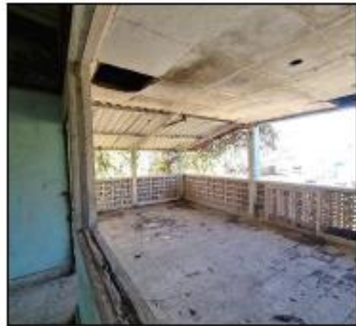
DAÑOS EN SEGUNDO NIVEL