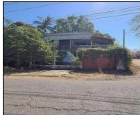
FACHADA DE VIVIENDA