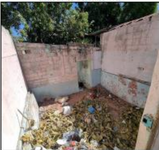
VISTA DE CONSTRUCCION DE UN NIVEL CON DAÑOS