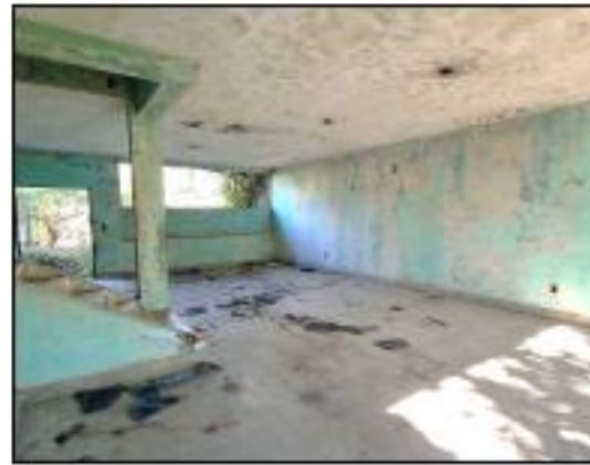
VISTA DE PRIMER NIVEL EN MAL ESTADO