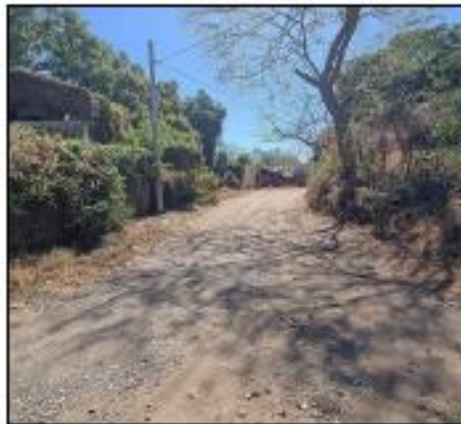
CALLE DE ACCESO