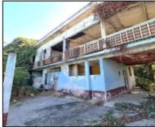
VISTA EXTERIOR DE CONSTRUCCION DE DOS NIVELES