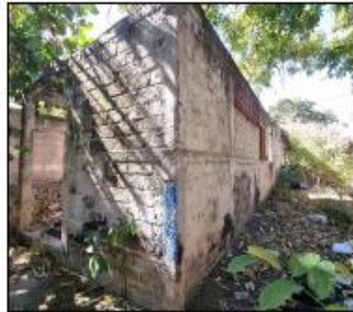
VISTA DE CONSTRUCCION DE UN NIVEL