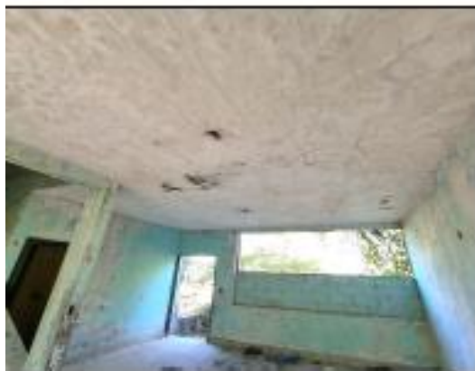
DAÑOS EN LA LOSA DE CONCRETO POR FILTRACION