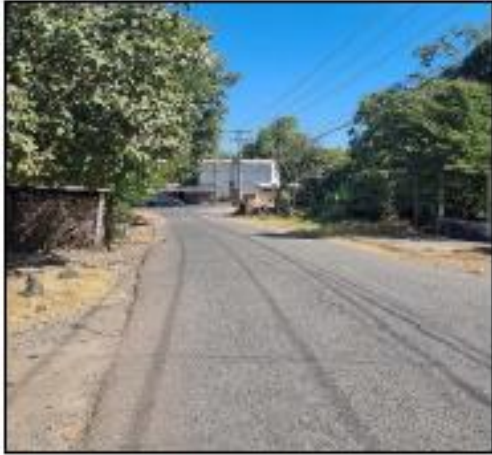
CALLE DE ACCESO