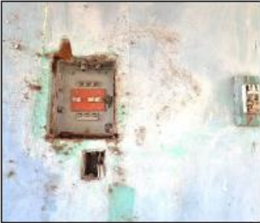
DAÑOS EN SISTEMA ELECTRICO DE LA VIVIENDA