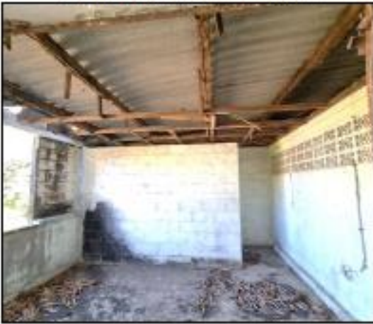
DAÑOS EN TECHO SEGUNDO NIVEL