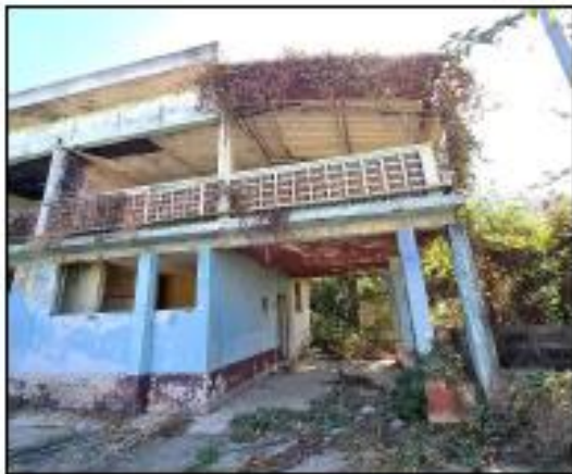
VISTA DE CONSTRUCCION DE DOS NIVELES