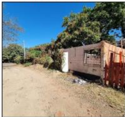
VISTA DE CONSTRUCCION DE UN NIVEL DAÑADA