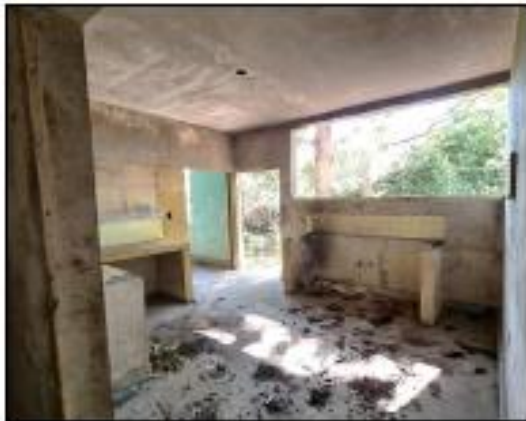
VISTA DE PRIMER NIVEL EN MAL ESTADO