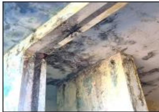
DAÑOS EN HIERRO DE REFUERZO POR SALINIDAD