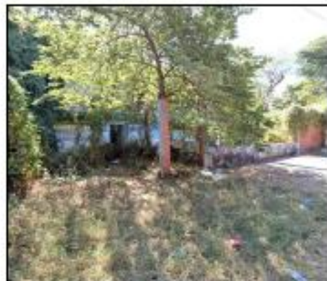
VISTA TAPIALES LINDERO PONIENTE