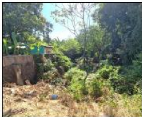
VISTA DE QUEBRADA EN LINDERO NORTE