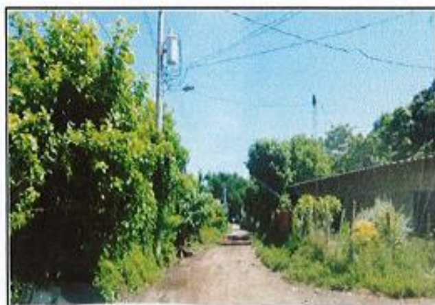
CALLE PRINCIPAL DE LA LOTIFICACION