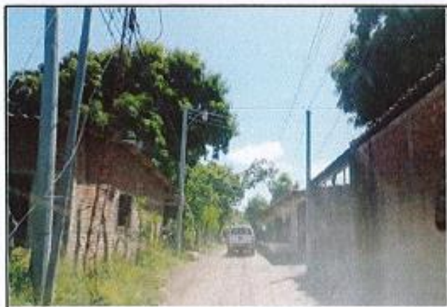
CALLE DE ACCESO AL INMUEBLE