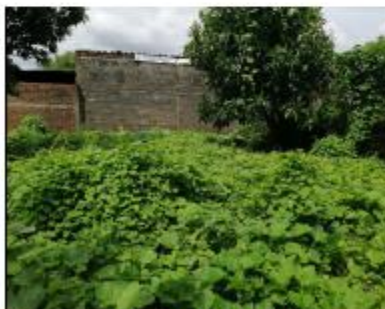
INTERIOR DE INMUEBLE