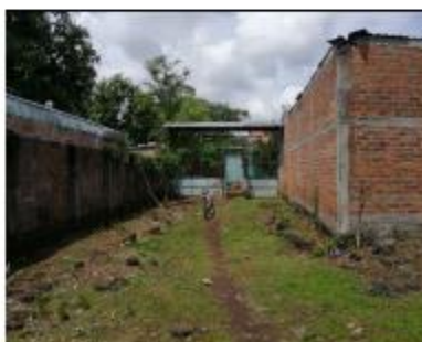
SERVIDUMBRE DE ACCESO