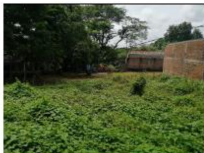
INTERIOR DE INMUEBLE