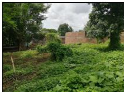
INTERIOR DE INMUEBLE