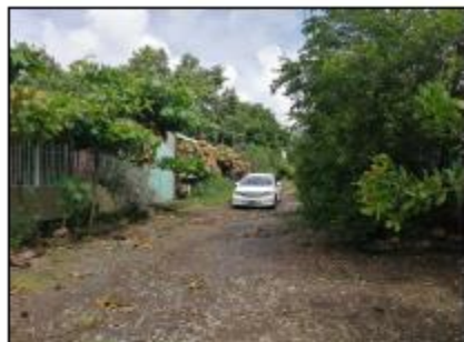
CALLE DE ACCESO