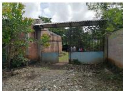
FACHADA SERVIDUMBRE DE ACCESO