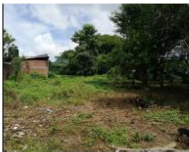
INTERIOR DE INMUEBLE