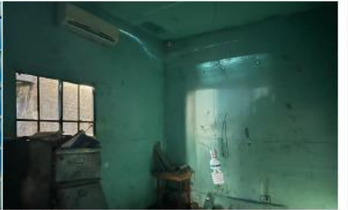
INTERIOR DEL INMUEBLE