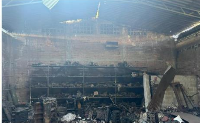
INTERIOR DEL INMUEBLE