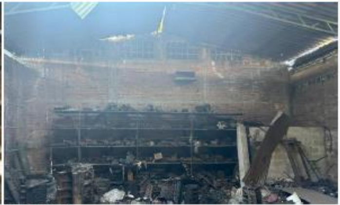
INTERIOR DEL INMUEBLE