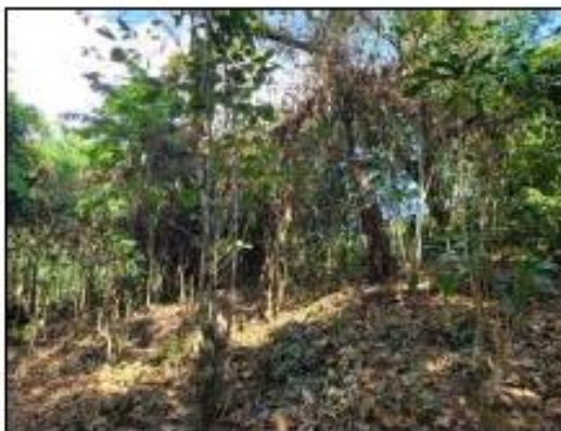
FINCA SIN PODA SANITARIA