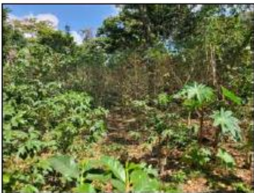
FINCA SIN PRACTICAS DE MANTENIMIENTO