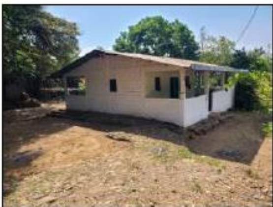
CASA DE COLONOS