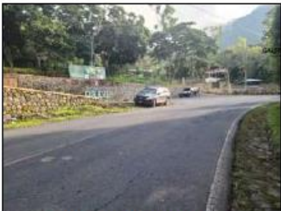
PUNO DE PARTIDA HACIA FINCA