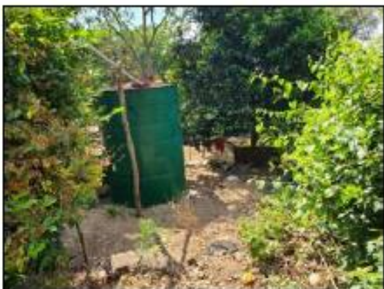
TANQUE DE CAPTACION DE AGUA