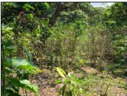
AREA SIN ASISTENCIA TECNICA