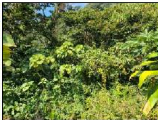
FINCA CON CAFETO ENGALERADO