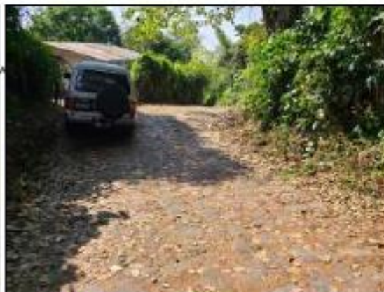
ACCESO POR CALLE EMPEDRADA