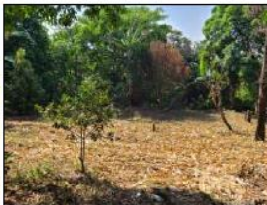
TRASPATIO DE CASA DE COLONOS