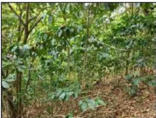
AREA CON LA COSECHA YA RECOLECTADA