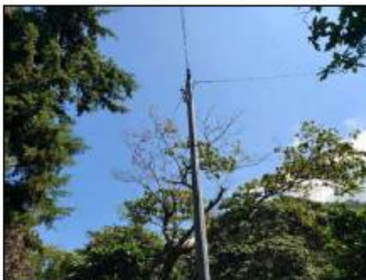
TENDIDO ELECTRICO INMEDIATO