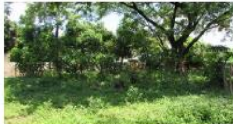
VISTAS INTERNAS DEL INMUEBLE