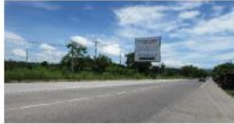
AUTOPISTA COMALAPA DE ACCESO PRINCIPAL