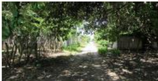
AVENIDA EL LEON DE ACCESO