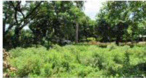
VISTAS INTERNAS DEL INMUEBLE