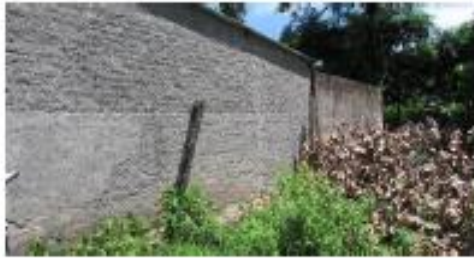
VISTAS INTERNAS DEL INMUEBLE