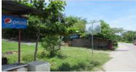
ACCESO SOBRE AUTOPISTA COMALAPA