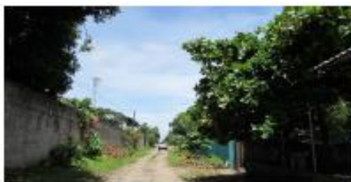
CALLE LA PAZ