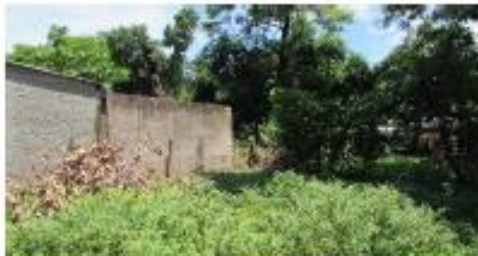
VISTAS INTERNAS DEL INMUEBLE