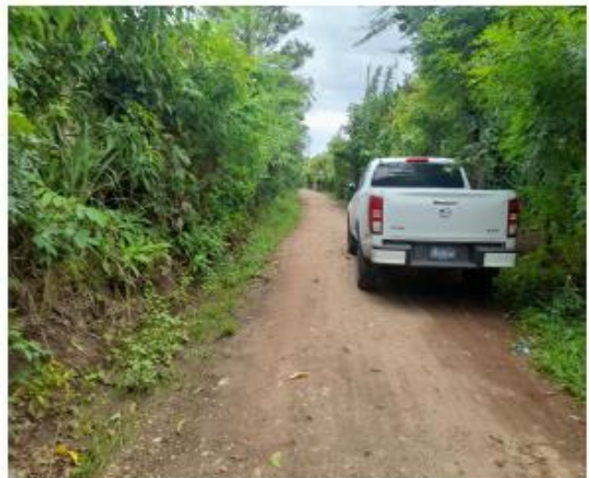
CALLE DE ACCESO