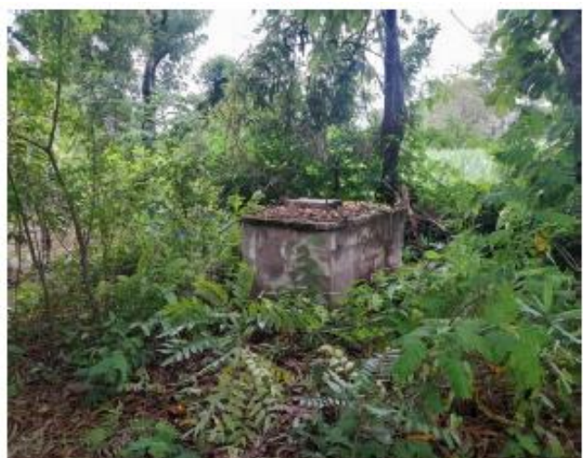
RESTOS DE LETRINA