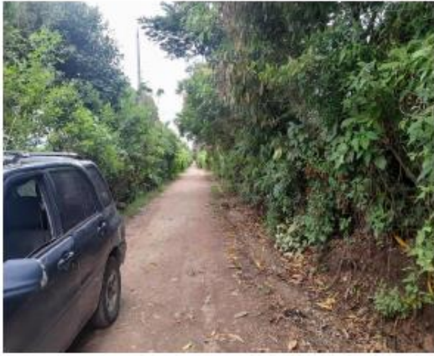
CALLE A EL REFUGIO