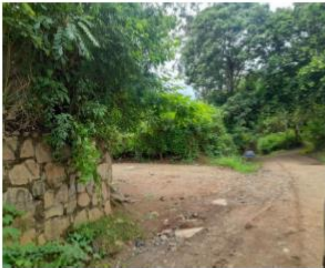
DESVIO DE CALLE AL INMUEBLE